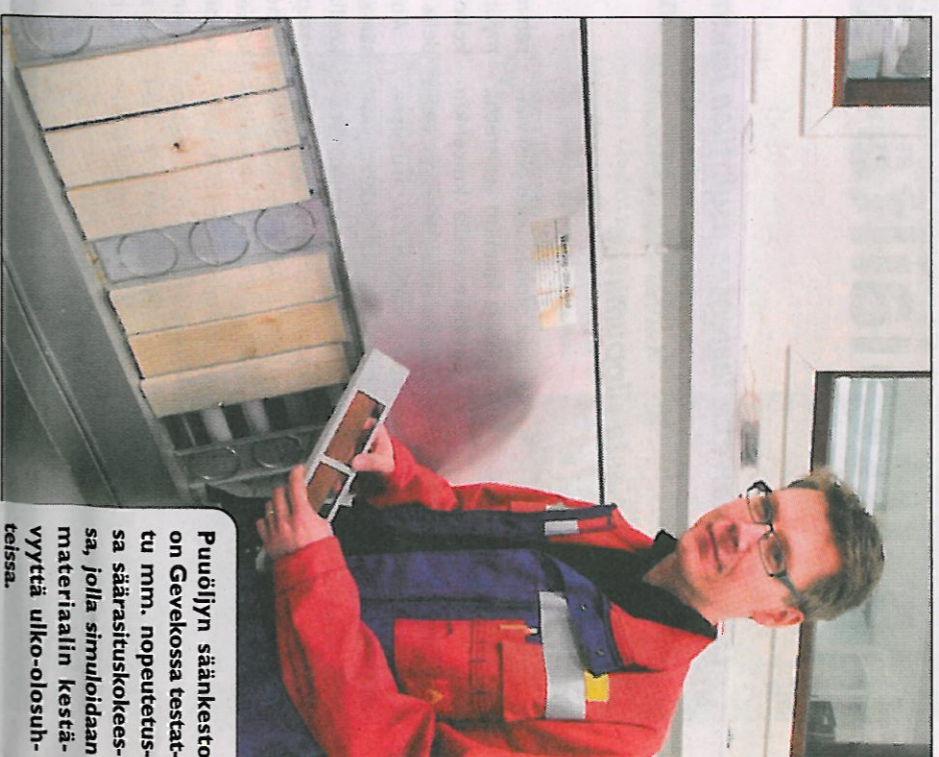
Puuöljyn säänkesto on Gevekossa testattu mm. nopeuteutta säärasituskokeessa, jolla simuloidaan materiaalin kestävyttä ulko-olosuhteissa.

henteiset tuotteet ovat jo suosituimpia, mutta kuulravissa tuotteissa liuotinpohjaiset tuotteet ovat vielä pääosassa. Monet kuluttajat ovat tuskastuneet liuotinhenteisten maalien hajun ja työvälineiden hankalaan pesuun. Geve Puuöljy Strong on puuöljymuotio, jossa perinteisesti liuotinpohjaisissa tuotteissa käytetty öljy on emulgoitu veteen ja näin puuöljyn saadaan sekä öljyn että vesiohenteisuuden edut. Lopputuotoksena on hyvä säänkesto, mutta ilman liuotinkäryä. Myös työvälineiden pesu on helppoa.